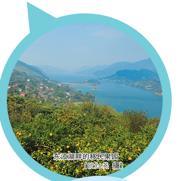
东江湖畔的移民果园

近些年来,资兴市更是持续加大投入,不断完善库区和外迁移民的基础设施建设。2019年,清源公路建成通车,又有2万多库区群众告别了“过轮渡,绕山路”的历史,圆了30多年的“交通梦”。截至目前,资兴市已累计投入2.88亿元用于移民基础设施建设,新建、硬化公路30395公里,实施安全饮水工程80626千米、农田水利工程建设44461千米、新农村建设工程4100处。东江湖区公路交通网、水利设施不断完善,学校、医院、市场等逐步重建配套,移民出行、用水用电、就医就学等难题都得到妥善解决。6万移民安定下来,在新家园一心一意谋发展,专心致志忙创业。