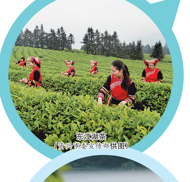
东江湖茶