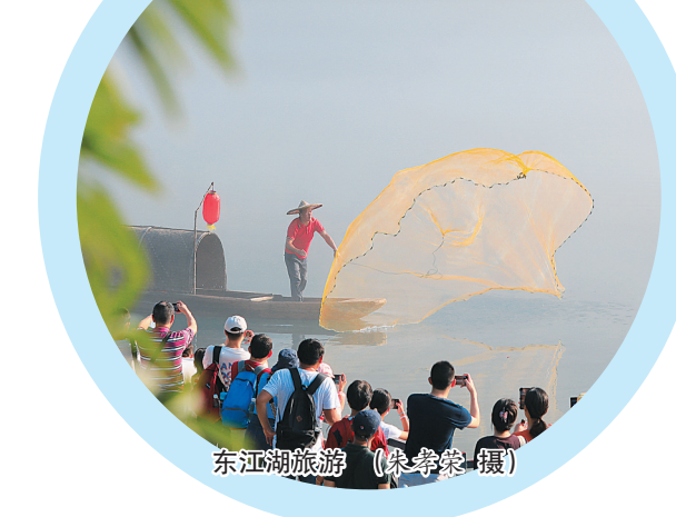
东江湖旅游

乘船来到资兴市清江镇青草村,首先映入眼帘的是移民码头边的精美墙画。墙画从山美、水美、人美、业美等方面,展示了库区移民种植、采摘、销售柑橘等场景,让人在欣赏东江湖美景之余,对库区移民产业发展也有一定的了解。