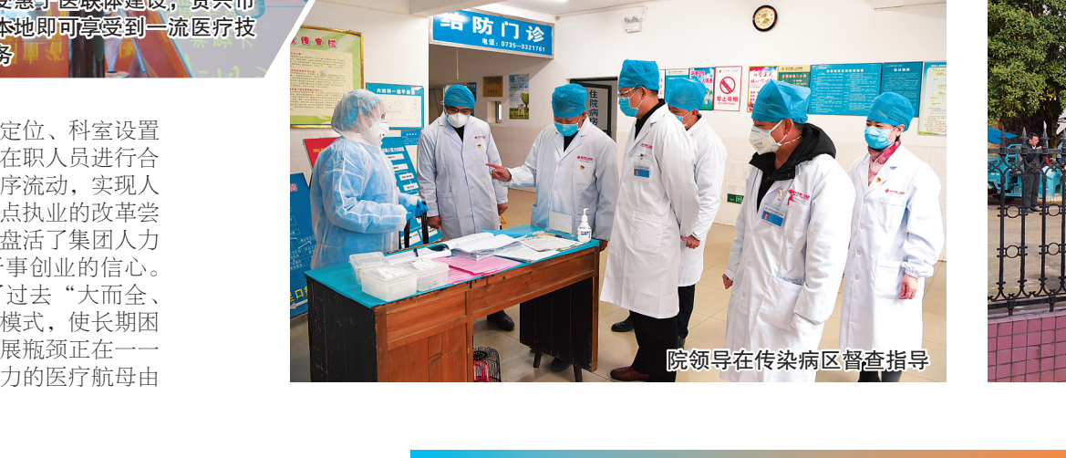
院领导在传染病区督查指导

国家政策范围内,集团建立科学的人员流动机制,依各自的功能定位、科室设置等具体情况,对所有在职人员进行合理调配,促进人员有序流动,实现人力资源共享,推行多点执业的改革尝试。灵活的用人机制盘活了集团人力资源,增强了职工干事创业的信心。体制改革彻底改变了过去“大而全、小而全”的医院经营模式,使长期困扰我市的医疗技术发展瓶颈正在一一被突破,一个充满活力的医疗航母由此呈现。