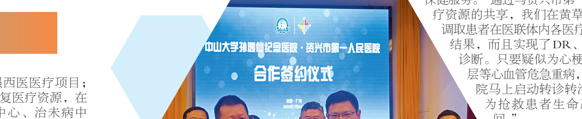
资兴市一医与中山大学孙逸仙纪念医院签署医疗技术合作协议

别就“双向转诊”“医疗技术合作医院”“医联体”“湖南儿科医疗联合体指导医院”“湖南综合医院儿科联盟”等不同形式的分级诊疗服务签订了合作协议。以医疗技术为纽带,这些上级医疗机构在医院管理、人才培养、学科建设等方面给予资兴市医疗集团全方位指导与帮扶,开通双向转诊就医绿色通道,并通过重点学科建设、远程会诊、专家医疗队巡回指导、派遣专家教授定期来院坐诊等手段,为医院开展疑难危重病例会诊、查房、义诊、讲座、手术等医疗活动和业务培训,让资兴市民在家门口就能享受三级医院的医疗服务,推动了上级优质医疗卫生资源的下沉,带动了资兴市医疗集团整体医疗技术水平的逐步提升。同时,集团作为上级医疗机构患者“下转”的载体,通过上下联动的医疗服务,全程跟踪下转病人的疾病治疗情况和健康恢复情况,既缓解了上级医院病人“人满为患,一医难求”的局面,又保障了病人疾病能够得到有效医治,还减轻了患者医疗费用负担,实现了互利多赢的良好格局。