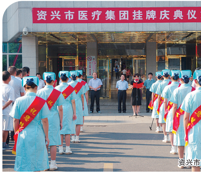
资兴市医疗集团挂牌

感控专家认真落实消毒隔离制度、手卫生制度等,强化各医疗区感染防控专门培训、专业指导和专项检查; 完善、规范新冠肺炎确诊患者转运流程,120急救中心开启快速运转模式; 筛查、检测纵深到底、覆盖到边…… 围绕“防、控、治、保”各个环节,资兴市医疗集团坚持集团医疗单位一盘棋、一条心,第一时间响应,第一时间行动,阻击疫情的“作战图”迅速铺开。 对所有进出资兴辖区人员进行流调以及体温检测,对所有来院患者及其陪同人员进行体温检测,发热患者凭体温检测单优先就诊,开通绿色通道;加强对重点人群的筛查和诊治,严格预检分诊和发热病人登记报告转诊;对疑似病例解除隔离进行评估…… 上下同欲者胜,同舟共济者赢。 经过艰苦卓绝的努力,医疗集团最终实现了全市“零漏诊,零死亡,零交叉感染”的工作目标。