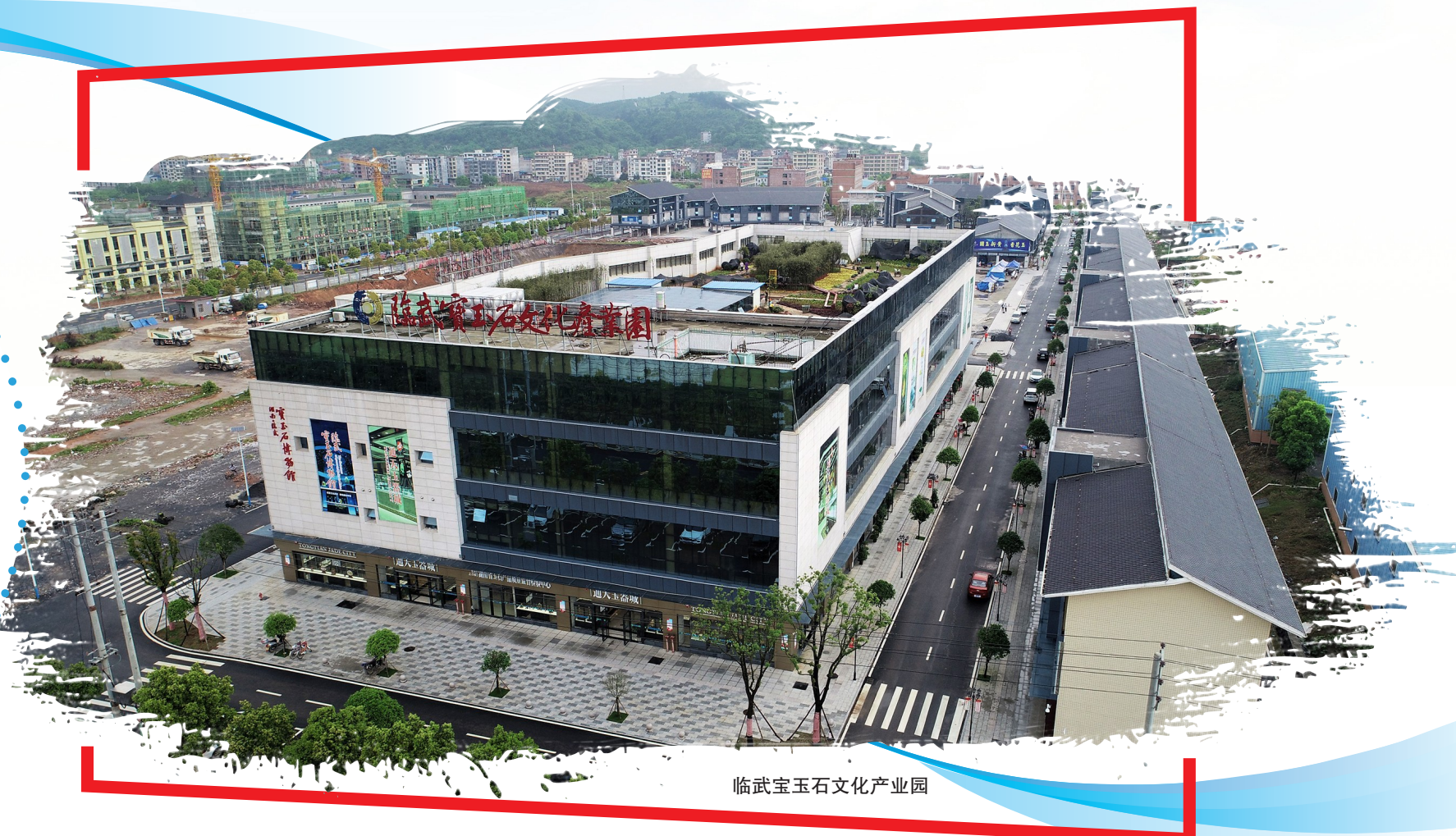
临武宝玉石文化产业园