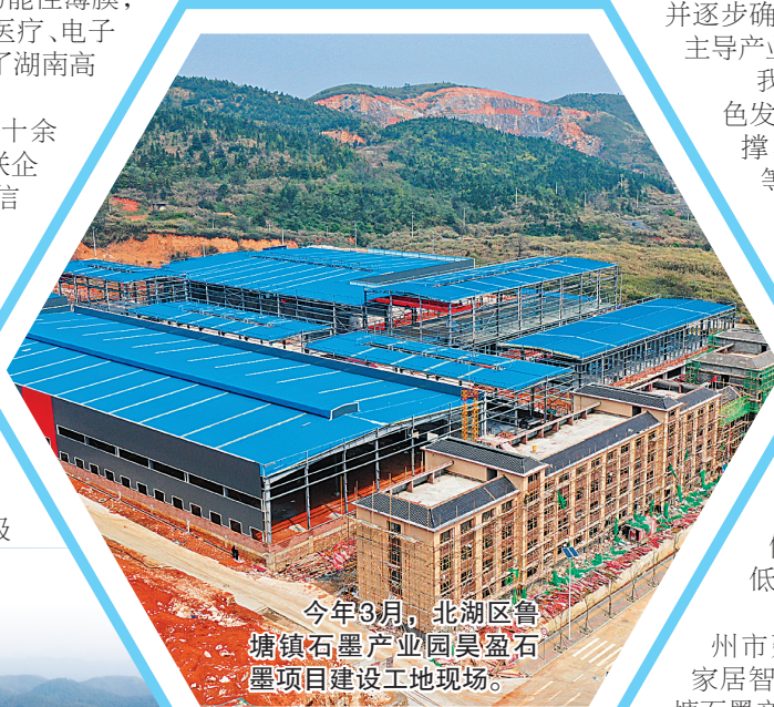
今年3月，北湖区鲁塘镇石墨产业园昊盈石墨项目施工现场。