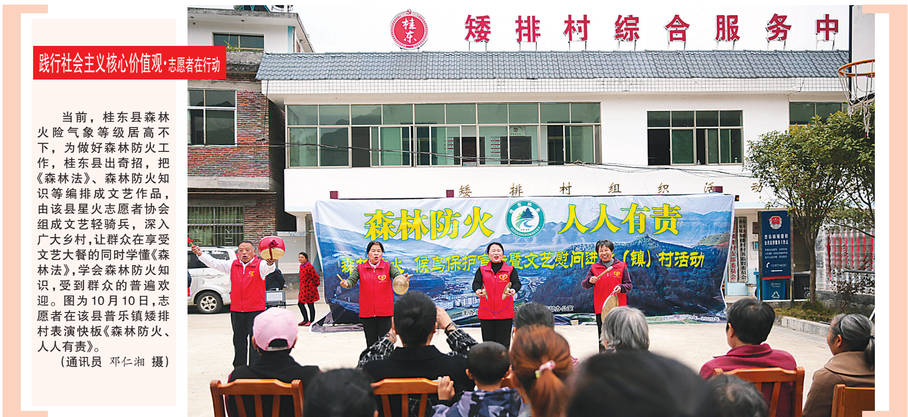
践行社会主义核心价值观·志愿者在行动

当前,桂东县森林火险气象等级居高不下,为做好森林防火工作,桂东县出奇招,把《森林法》、森林防火知识等编成文艺作品,由该县星火志愿者协会组成文艺轻骑兵,深入广大乡村,让群众在享受文艺大餐的同时学懂《森林法》,学会森林防火知识,受到群众的普遍欢迎。图为10月10日,志愿者在该县普乐镇矮排村表演快板《森林防火、人人有责》。