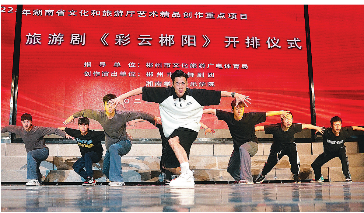
2022年湖南省文化和旅游厅艺术精品创作重点项目