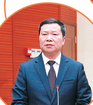
市教育局局长李鸿春