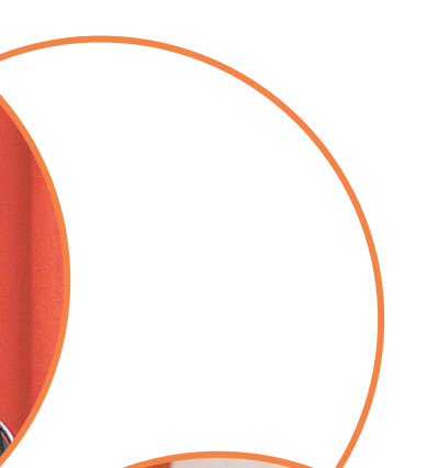
市国资委主任喻棉秀