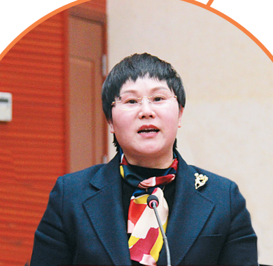
市教育局局长李鸿春