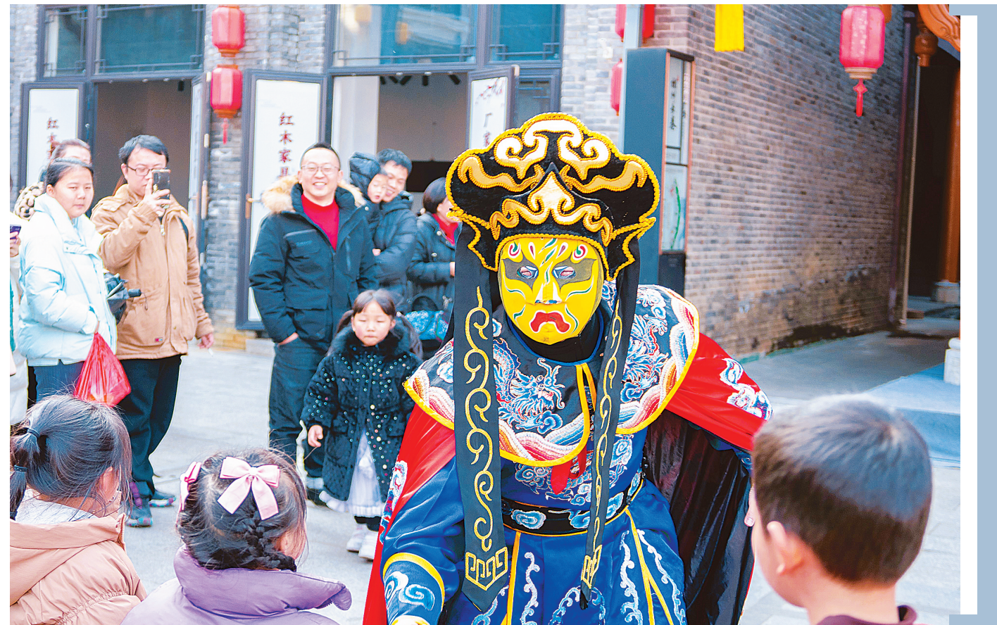
近日,由郴州市文化旅游广电体育局指导、郴州市文化馆主办的郴州长卷国潮非遗潮玩文化节在郴州长卷历史文化街区惊艳亮相。本次文化节集合了非遗之美、非遗之乐、非遗之趣、非遗之味四大活动主题,吸引了众多游客前来参与。

（上接1版）汉《郡国志》记载：“程乡出美酒者也，古置官酝。”三国《桂阳记》记载：“桂阳程乡有千里酒。”郴州晋简也记载：“呈乡献酒官。”