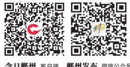
今日郴州 客户端 郴州发布 微信公众号