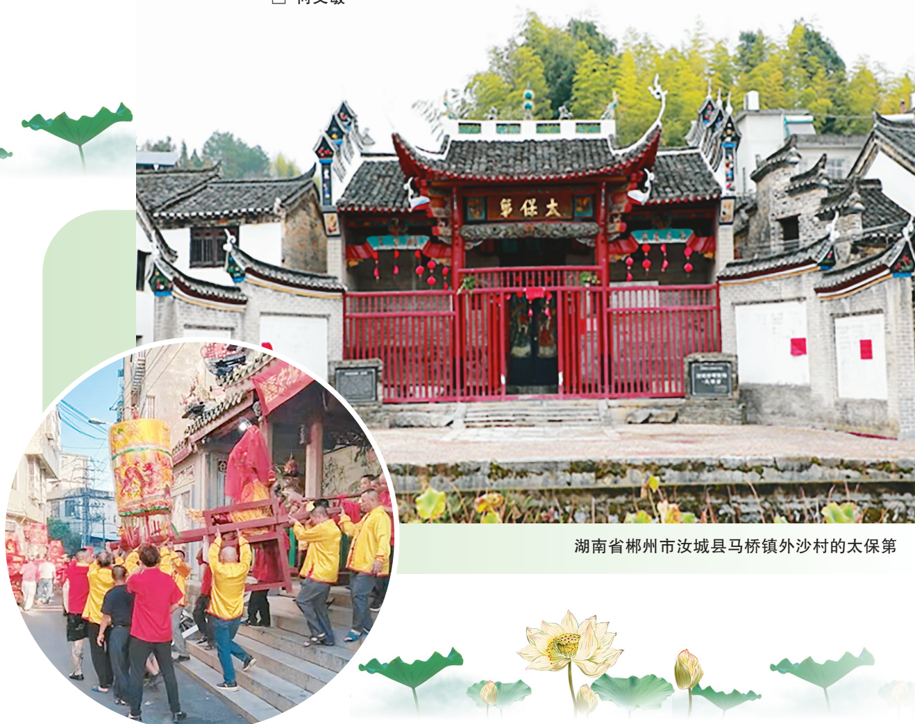
湖南省郴州市汝城县马桥镇外沙村的太保第

成化十一年（1475），朱英被任命为两广总督，面对边疆动荡不安的局面，他以安定清静为原则，继续推行均徭法，并成功招抚了瑶族、壮族等少数民族，使他们成为编户，免除三年徭