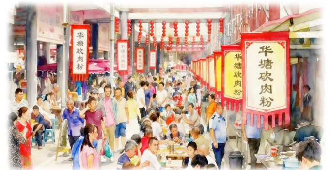
AI水彩画华塘砍肉粉市场

如果您来到郴州,想体验最地道的市井美食,不妨来到北湖区华塘镇,吃上一碗热腾腾、香喷喷的砍肉粉,让您的旅程增添一抹难忘的记忆。