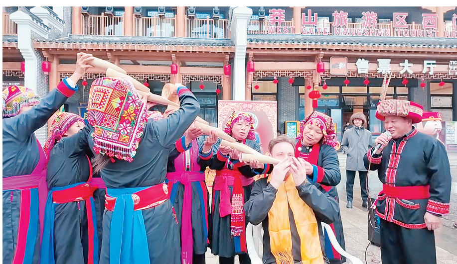
郴州日报·今日郴州客户端讯(通讯员 李永东 彭辉)2月24日,笔者从相关部门获悉,9天长假点燃游客出游热情,

宜章县文旅消费交出一份亮眼成绩单,全县共接待游客56.18万人次,实现旅游综合收入67416.19万元,分别比2025年同期