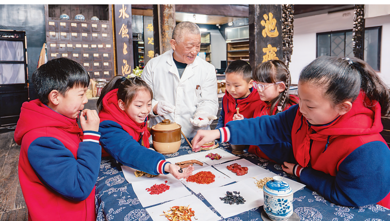
3月17日，在江苏省兴化市昭阳街道上池斋药店，兴化市范景学校学生在中药师的指导下学习中草药知识。3月17日是中国国医节，各地开展体验中医药文化主题活动。

春季农业生产、户外踏青、清明祭祀等野外用火增多，火灾风险较大。“清明节前后，要倡导文明祭祀，使用香烛时做好看护，不在林区、野外等地焚香烧纸、燃放烟花爆竹。”王玮说，要严格遵守各地大风天气禁火和野外用火的相关规定，避免在田间等随意焚烧秸秆和垃圾。 (据新华社北京3月17日电)