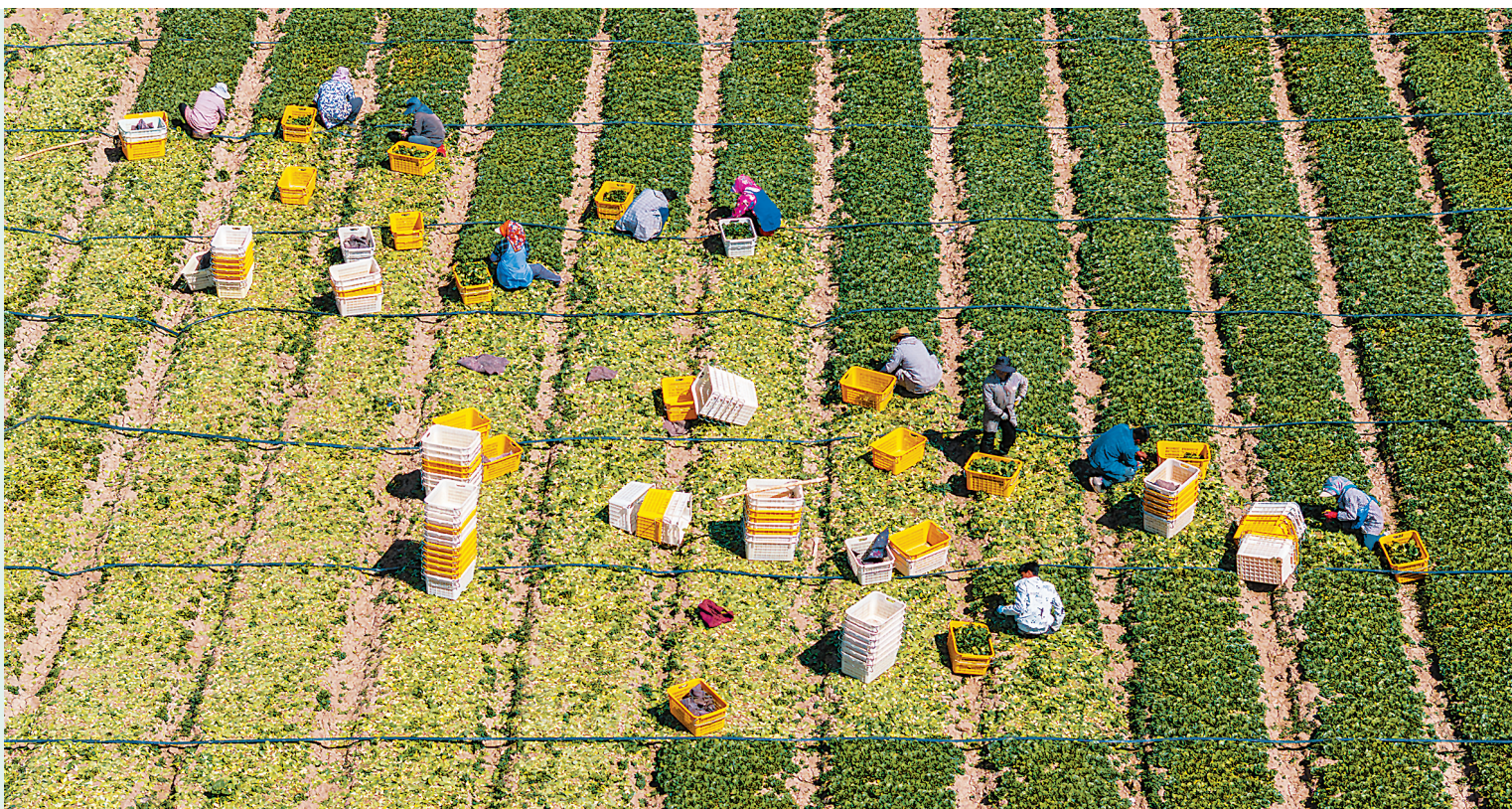
5月7日，采摘工在贺兰县立岗镇清凉蔬菜种植基地采摘菜心（无人机照片）。

近日，宁夏银川市贺兰县头茬清凉蔬菜进入采摘期。据了解，目前贺兰县清凉蔬菜种植面积约25万亩，当地种植的宁夏菜心、芥蓝、西兰花等蔬菜产品畅销京津冀、长三角、粤港澳大湾区等地。